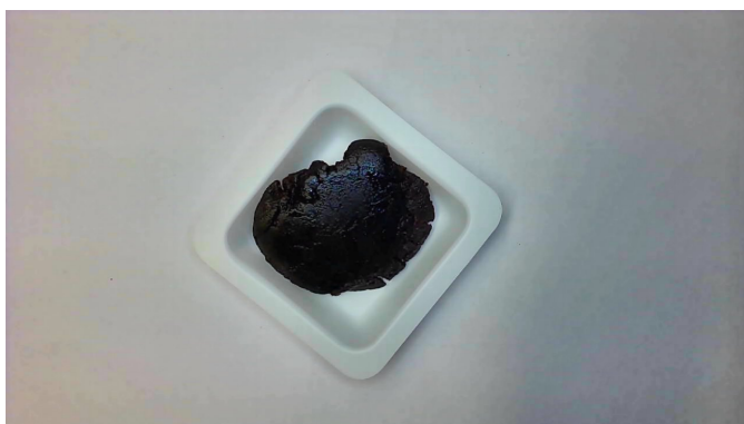
Bild der eingelangten Probe vom 17.11.2021